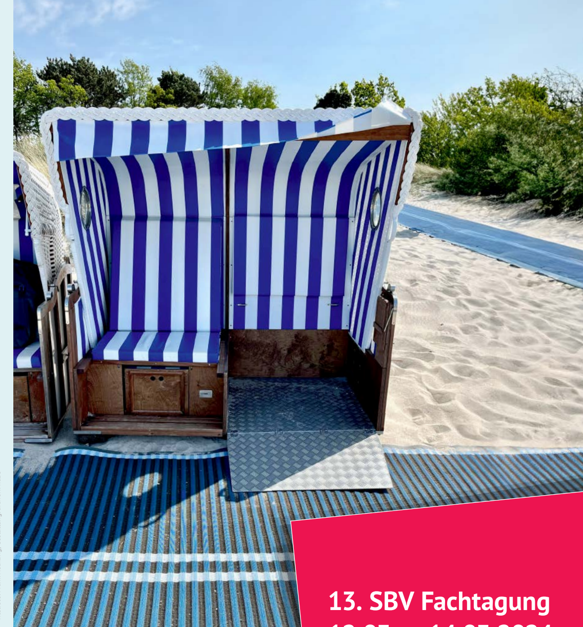
Gestaltung: anwerkshude

Parkgebühren sind nicht in der Tagungspauschale enthalten.